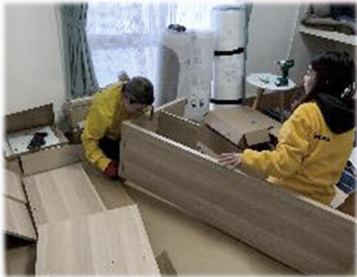
IKEAスタッフの皆さま

IKEAスタッフの皆さまの手であつという間に明るく温かいお部屋が出来上がり 立ち会ったファミリーハウススタッフ一同 感動と感謝の思いでいっぱいになりました。 IKEAさま 間接的にご支援いただいたIKEA Family会員の皆さまに 心より感謝申し上げます。 こうした社会からの温かいご支援を支えに 福岡ファミリーハウスは これからも病気の子どもとその ご家族が安心して過ごせる居場所を提供し続けるため 努力してまいります。